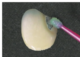
被着面の材質に応じた処理 ※画像はボンドマー ライトレス II で処理