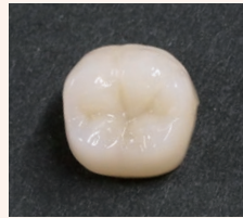
エステライトユニバーサルフロー A2で積層充填