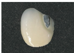
充填部の歯面清掃後