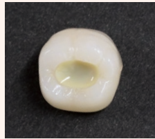
窩底部にトクヤマ マスキングオペカーを塗布・硬化