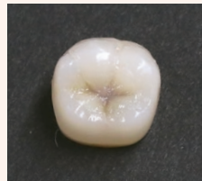
遮蔽材料を使用せず エステライトユニバーサルフロー A2 のみで充填した場合