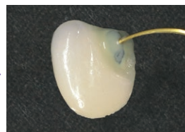
トクヤマ マスキングオペカーを充填 ※1回の充填厚みは0.5mm以内とする