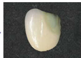
光照射後 ※800mW/cm以上の光照射器で 20秒を目安に光照射