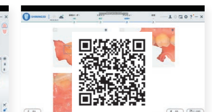
口腔内健康レポート